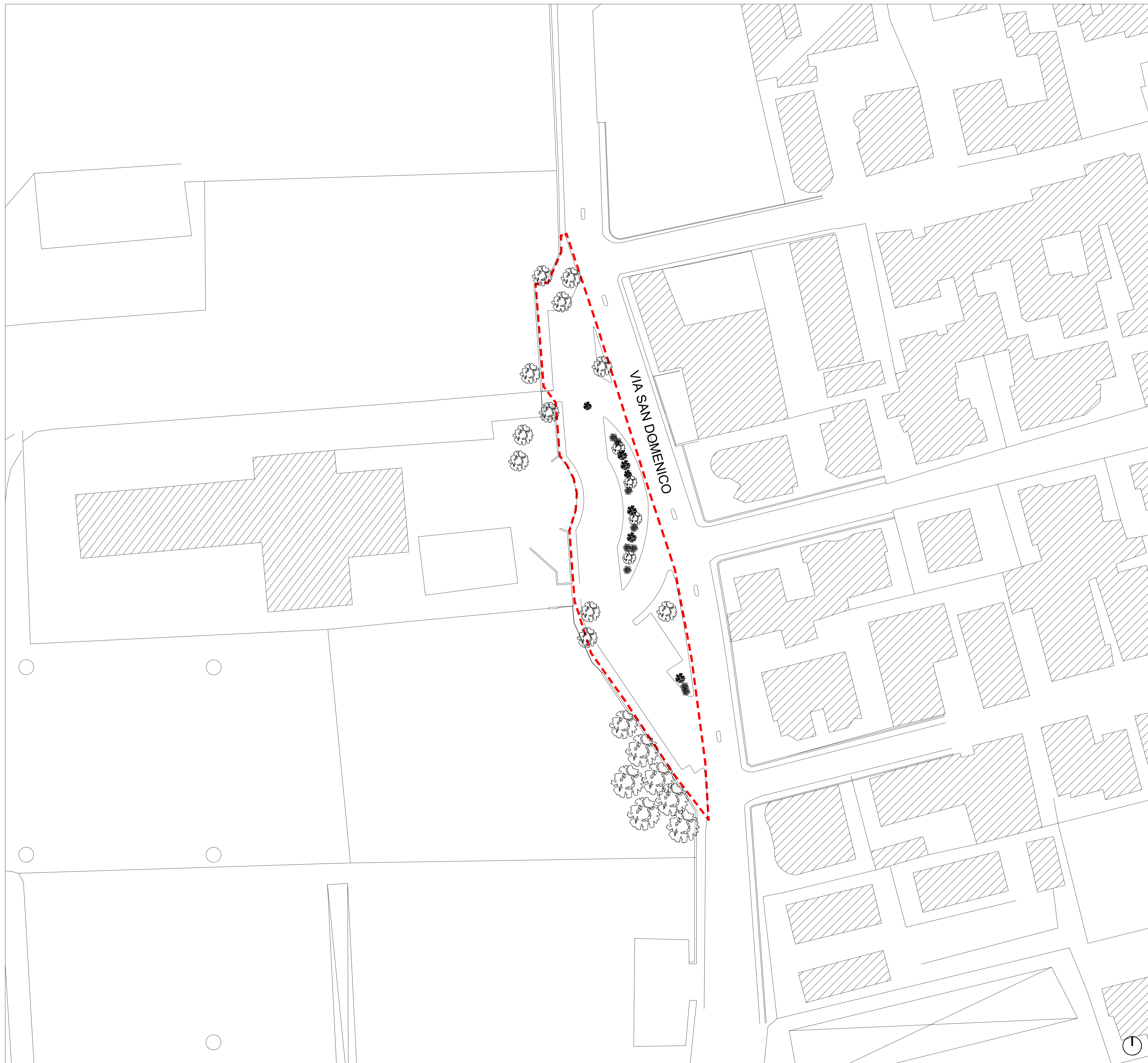
Planimetria d'insieme - stato di fatto - scala 1:500